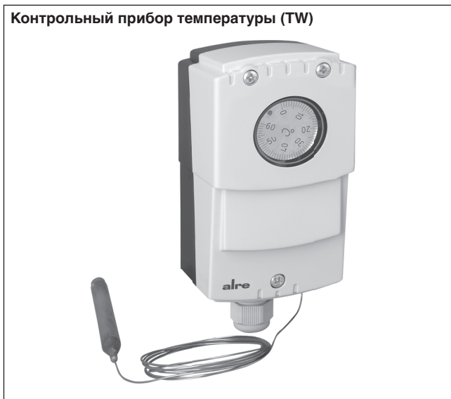
Контрольный прибор температуры (TW)