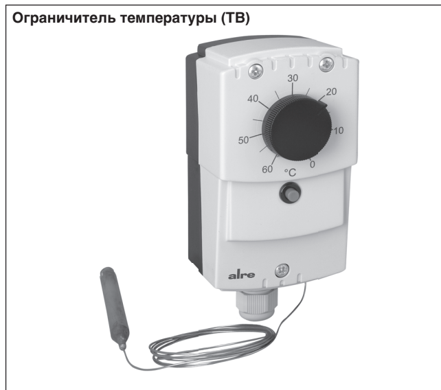
Ограничитель температуры (TB)